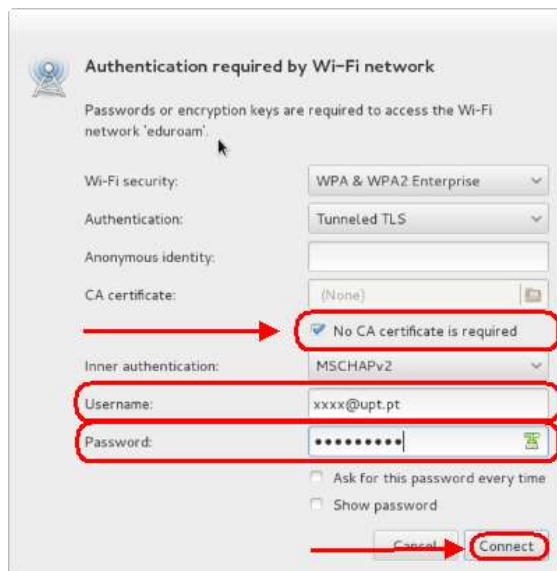
Figura 2 - Preenchimento dados

3º passo - Na janela que surgir, preencha os dados da seguinte forma, tendo em atenção que deverá colocar um visto na opção para tornar a necessidade de certificado não obrigatória: